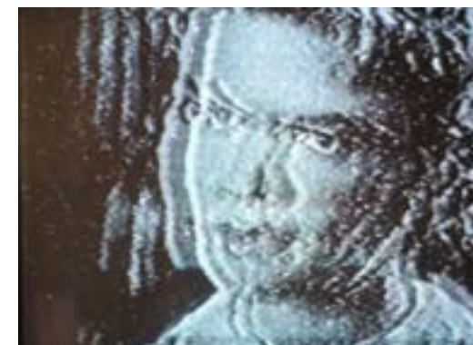
(Dis)Integrator , 1992, DVD, présenté sur moniteur de télévision (format original: VHS), 3 min 55 s