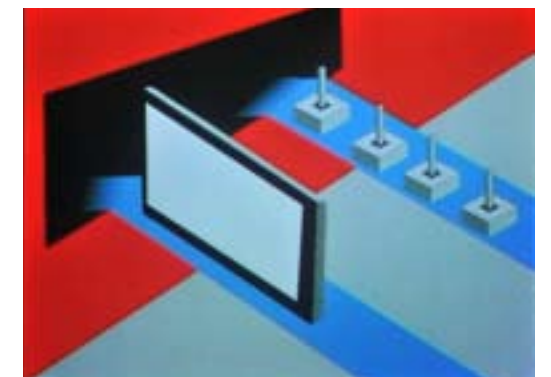
SEVnet , 2005, DVD, vidéoprojection (format original: mini DV), image Pekka Sassi, son Anton Nikkilä, 24 min 17 s