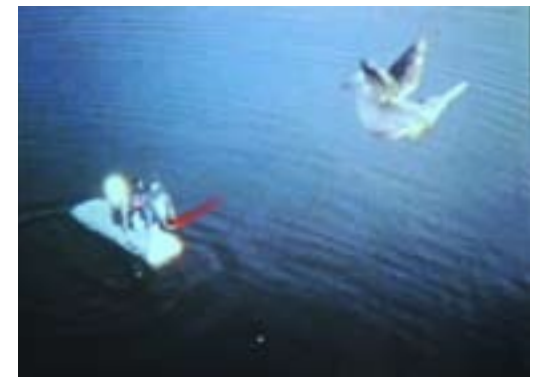
The Investigators , 2007, DVD, vidéoprojection (format original: réalisé en super-huit, support de conservation: mini DV), 15 min 18 s